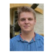
Mitte-glp-EVP u. Unabh. U. Herren F. Lerf