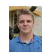
Mitte-glp-EVP u. Unabh. U. Herren F. Lerf